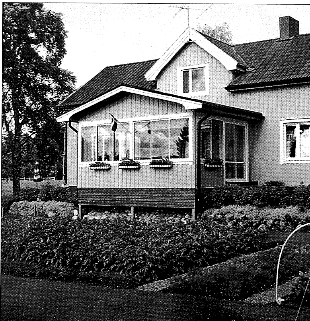
Det här huset återfinns numera i Yttersjö. Men det kommer ursprungligen från den gamla Strängnäs.

På den tiden flyttade man ut från sitt hem i Yttersjö och hyrde